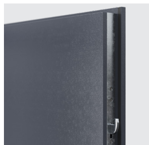
háky proti vylomení