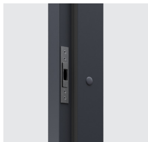
pohyblivé protiplechy háků zámku