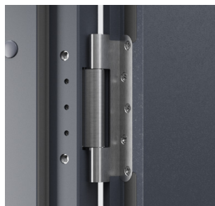
zpevněné objektové závěsy