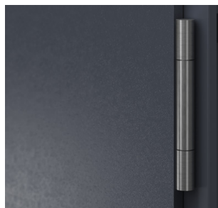
zpevněné objektové závěsy